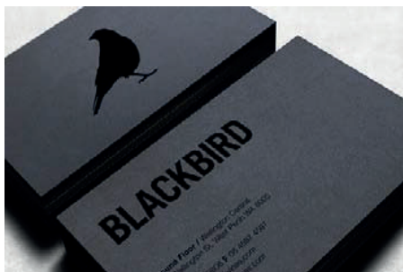
Nero lucido su nero opaco